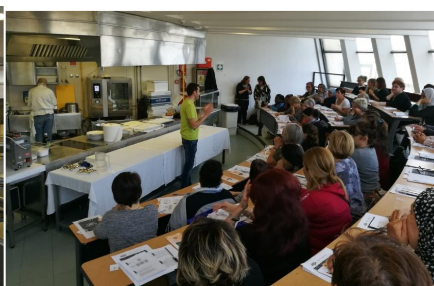
Tagliatelle al ragù