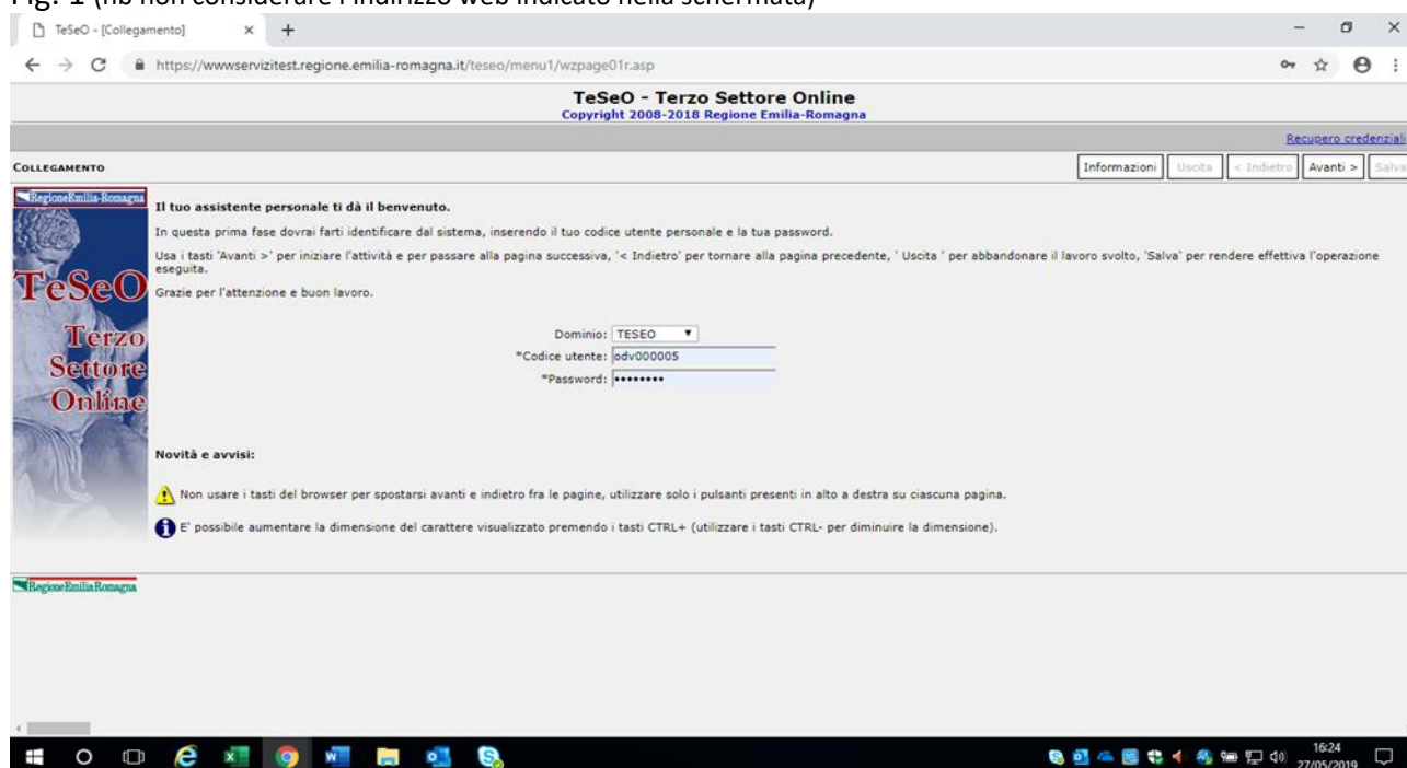
Fig. 1 (nb non considerare l'indirizzo web indicato nella schermata)

Per recuperare le credenziali di accesso (codice utente e/o password), cliccare, nella pagina di login, sul link in alto a destra Recupero credenziali (sempre Fig. 1) e seguire le indicazioni.