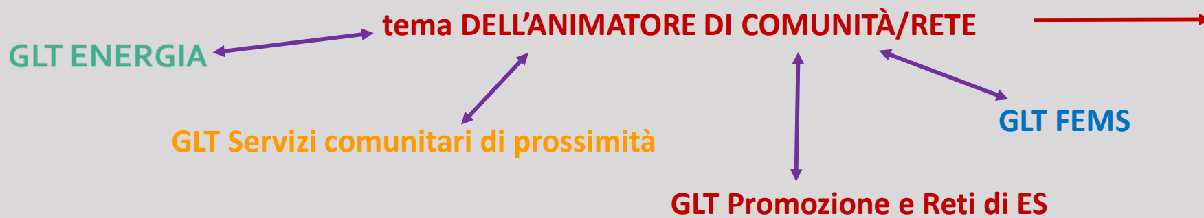
figura da formare un cardine delle azioni possibili sul territorio in ambito di ES

sta partecipando ad un progetto finanziato dalla Regione per portare valore aggiunto sul tema dell'animatore di rete/di comunità per poter evidenziare una buona pratica in azione.