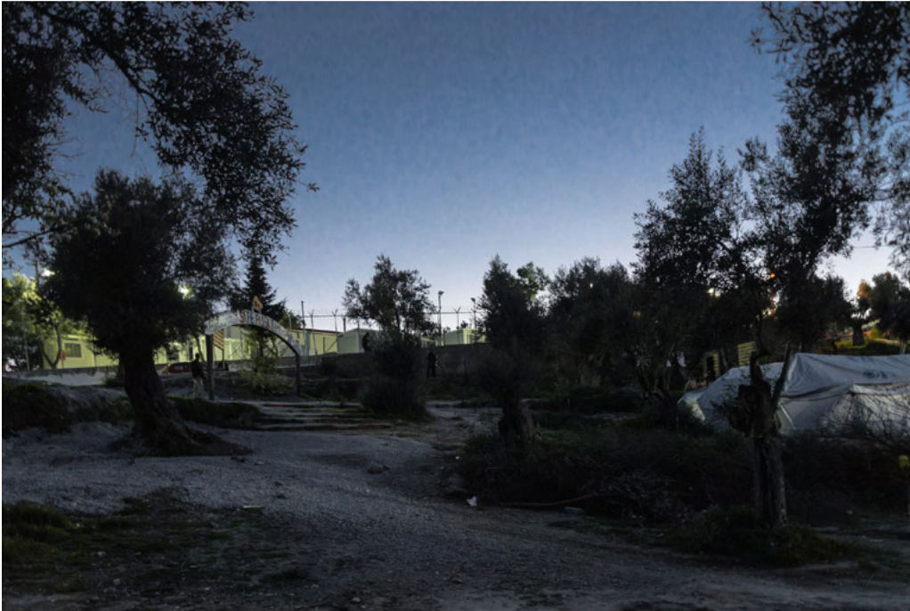
Outside the Hotspot of Moria