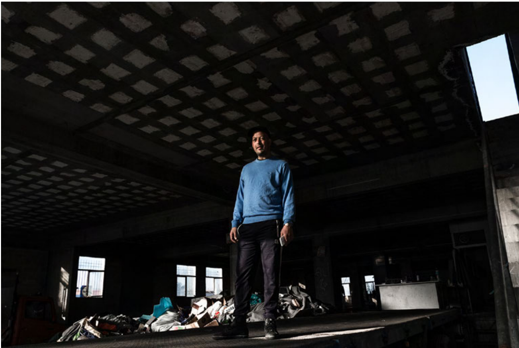
A migrant from Algeria living in an abandoned warehouse in Mytilene