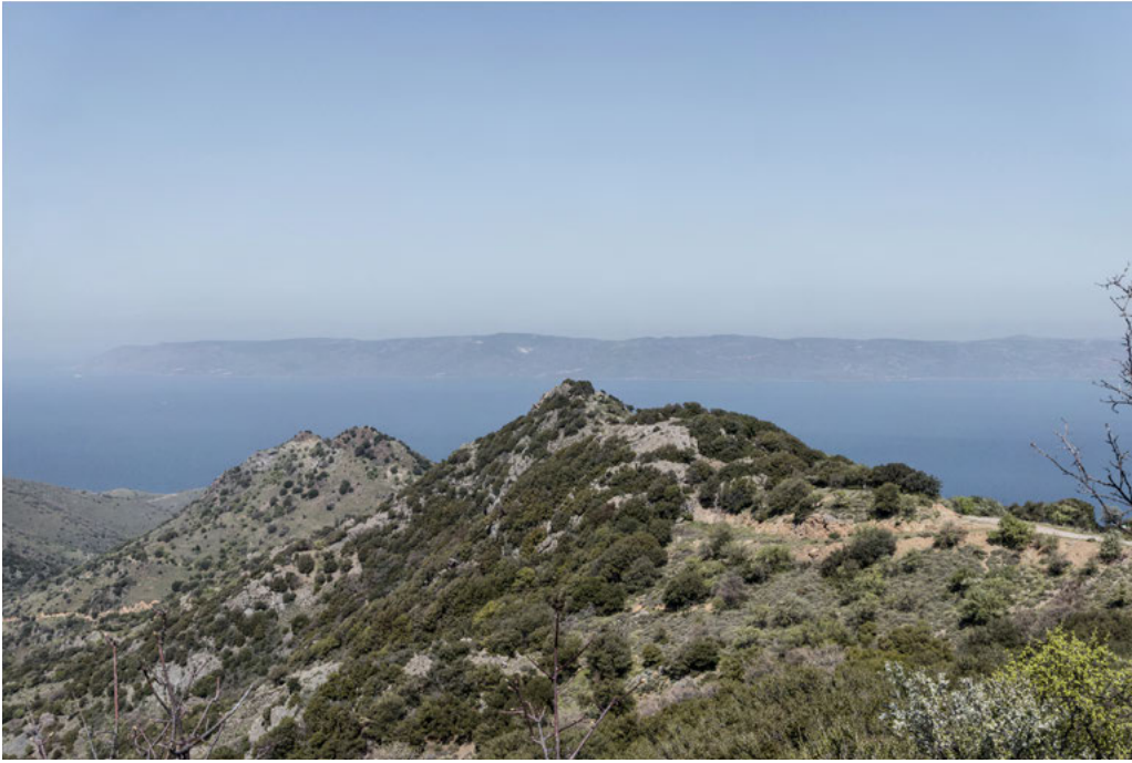
Turkish mainland seen from the top of a mountain in Lesbos