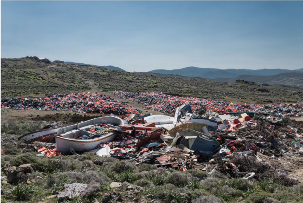
Here and above: Lifejackets and rafts in a dump in northern Lesbos