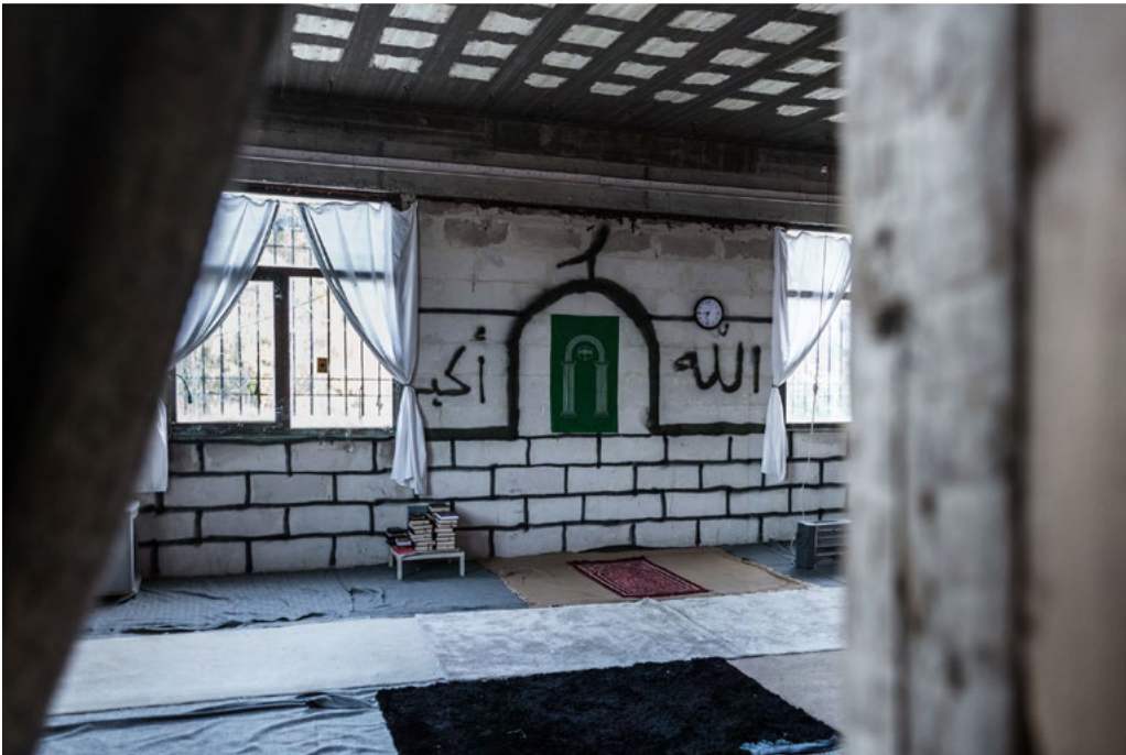
A place of worship built by migrants in the abandoned warehouse they have been occupying