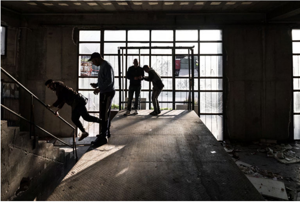
Algerian people living in an abandoned warehouse in Mytilene