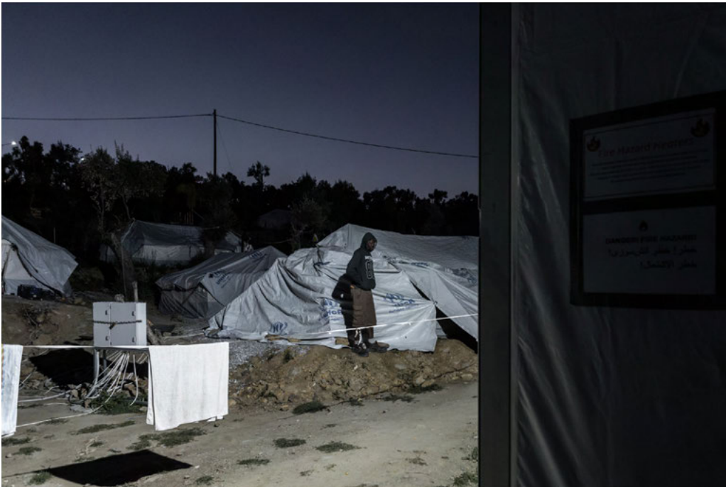
Outside the Hotspot of Moria. B., from Guinea, reached Lesbos by sea from Turkey