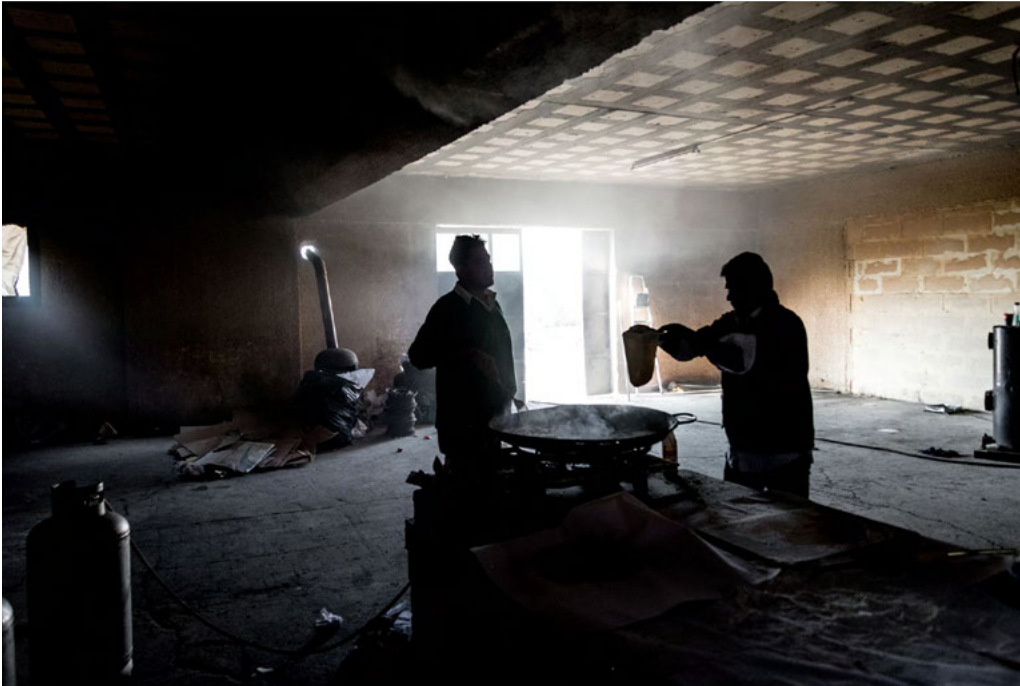
Pakistanis cooking chapati for all the migrants living in the abandoned warehouse they share with