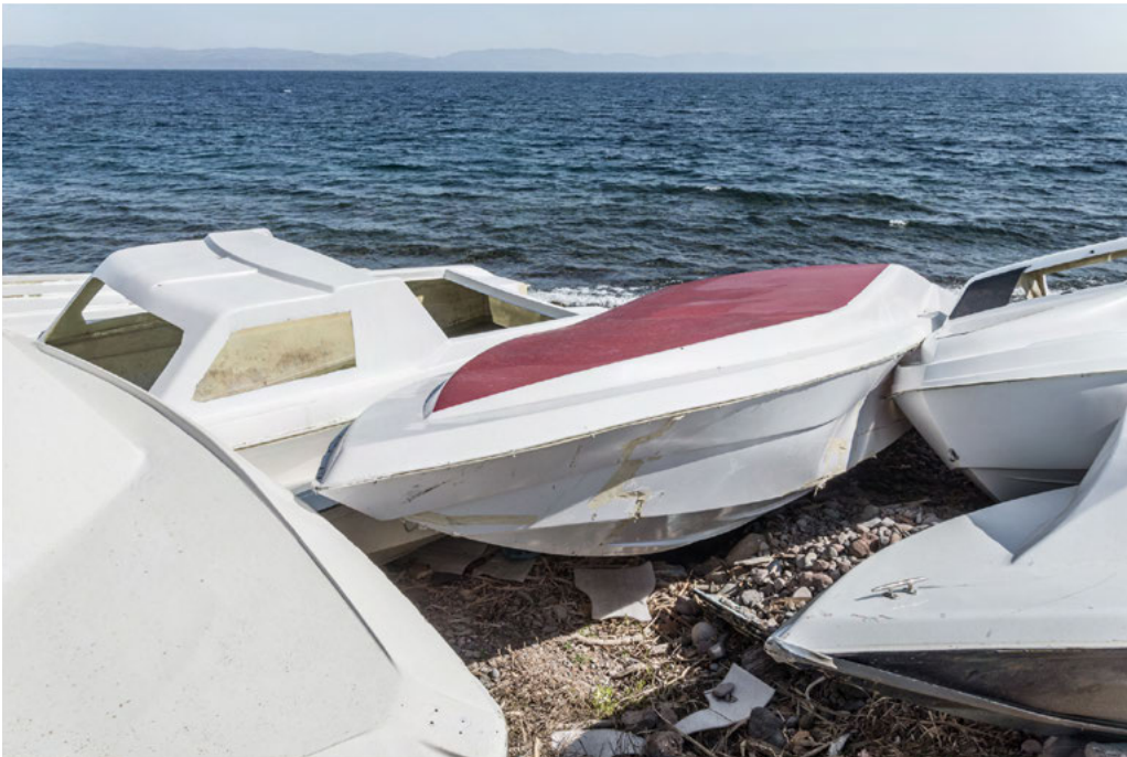
Turkish boats' wrecks on the shore in Skala Sikimineas