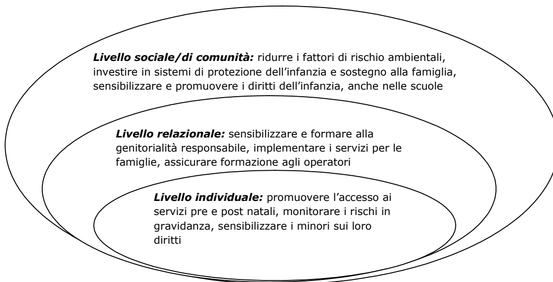
Figura 2. Prospettiva ecologica: strategie preventive.