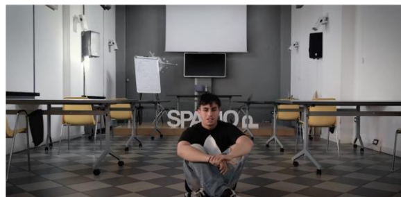
Cooperativa Sociale Gruppo Scuola Parma