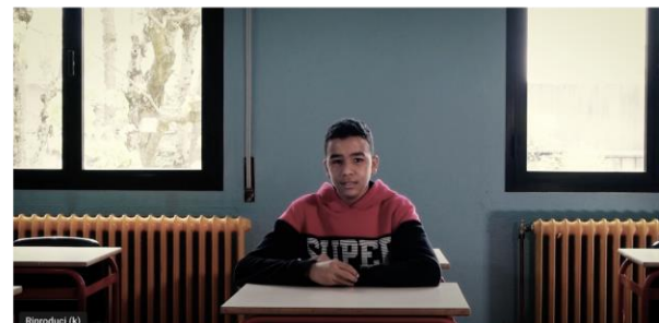
Futura Soc. Cons. r.l. San Pietro in Casale – BO