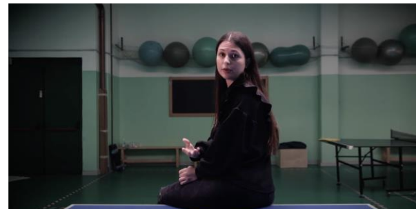
ITCS Gaetano Salvemini Casalecchio di Reno – BO