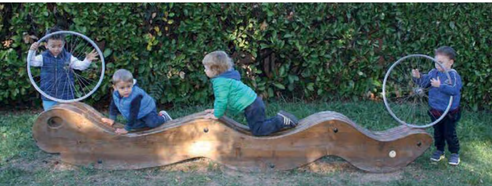
Collana "Educazione zerosei" Ed. "Multicentro educativo Sergio Neri", Modena, 2024