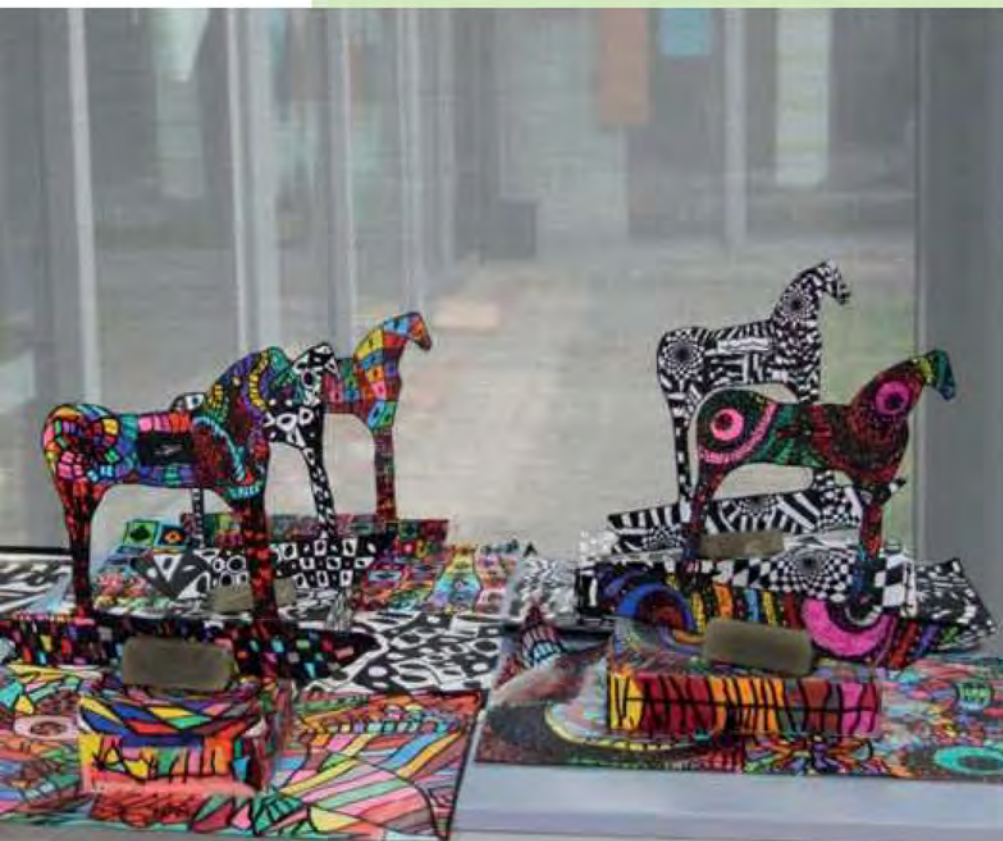
Studi sul cavallo di Modena Ed. "Me.Mo", 2018