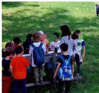
I bimbi a lezione all'aria aperta

domani della pandemia per offrire una cornice pedagogica e operativa agli educatori, rafforzare l'uso degli spazi esterni, ampliare le opportunità di gioco destrutturato, promuovere il biorispetto e la relazione con la natura, innovare il pensiero educativo dei servizi zero-sei. Le nuove Linee guida regionali riconoscono l'Outdoor education come «un'opportunità strategica per promuovere il benessere e lo sviluppo integrale dei bambini». Non si tratta, come sottolinea il documento, «semplicemente di stare fuori», ma di valorizzare «il ruolo educativo, relazionale e cognitivo dell'esperienza nella natura».