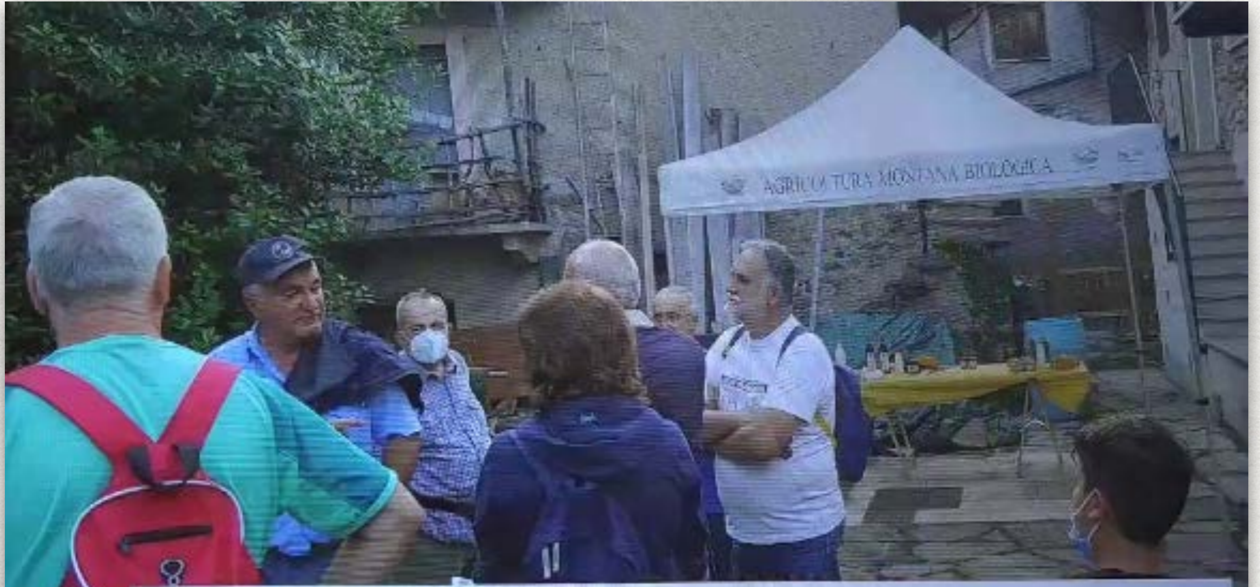
Bussoleno 15/07 gruppi di cammino